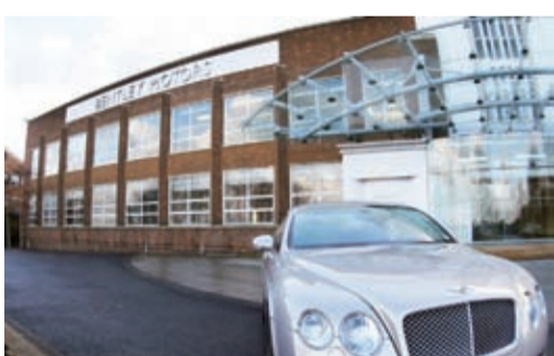
參考消息網11月3日報道——據英國《泰晤