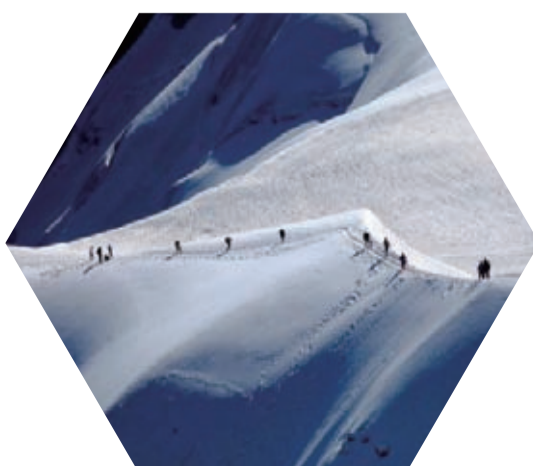
新華社北京11月3日電——聯合國教育科學文化組織3日發布報告稱，由於全球變暖，位

於世界遺產區的一些知名冰川可能會在2050年前消滅殆盡，包括意大利多洛米蒂山區、美國黃石和約塞米蒂國家公園、坦桑尼亞乞力馬扎羅山的冰川。